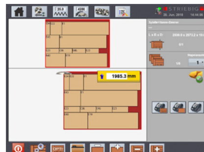
BaseCut CON Abarbeitung Schnittplan