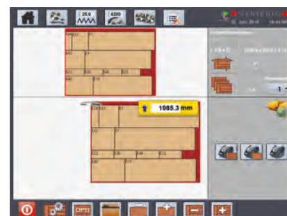
Elaborazione del piano di taglio BaseCut