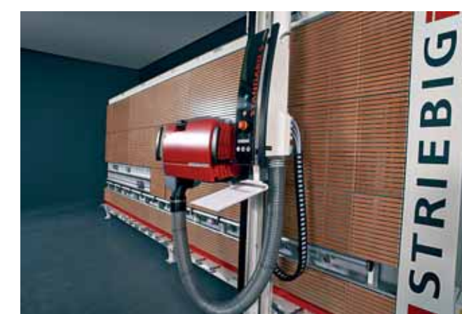
Ob die „4D“ (links) oder die neue „Standard S“ (oben): Das Produktportfolio von Striebig hält für jeden Nutzer die passende Lösung bereit