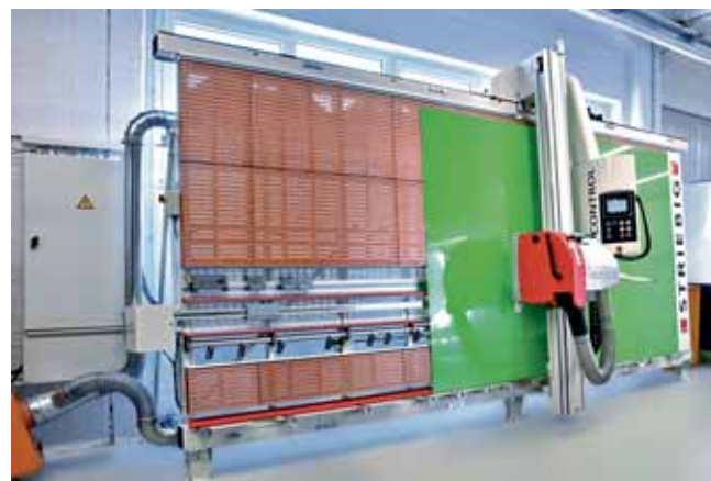
Zu den Vorteilen der vertikalen Sägetechnik von Striebig zählt auch die Möglichkeit, unterschiedliche Materialien platzsparend und effizient zuschneiden zu können