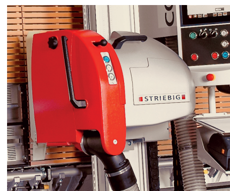
Verbesserte Standard-Ausstattung für Striebig 4 D und Control: ASP, die automatische Sägebalken-Positionierung. Das manuelle Verschieben des Sägebalkens entfällt, der Bedienerkomfort steigt.