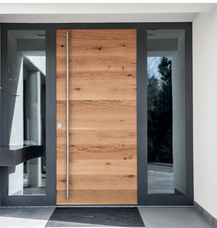
Natürliche Materialien mit hohem Komfort kennzeichnen Moll Haustüren – Echtholz-Oberfläche, hochwärmegeämmter Kern aus ökologischer Holzfaser.

Der Materialfluss durch die Produktion ist klar strukturiert. Wie überall in der Branche fehlt es an Platz. Standardmaschinen müssen wenig Fläche in Anspruch nehmen und problemlos zu bedienen sind. Gleichzeitig sollen sie nicht stören, wenn sie nicht im Einsatz sind. Ein Szenario, das in jedem Holz- und plattenverarbeitenden Betrieb auftritt. Einer der Klassiker ist dabei der Plattenzuschnitt. Bei der Moll'schen Produktionstiefe ist er