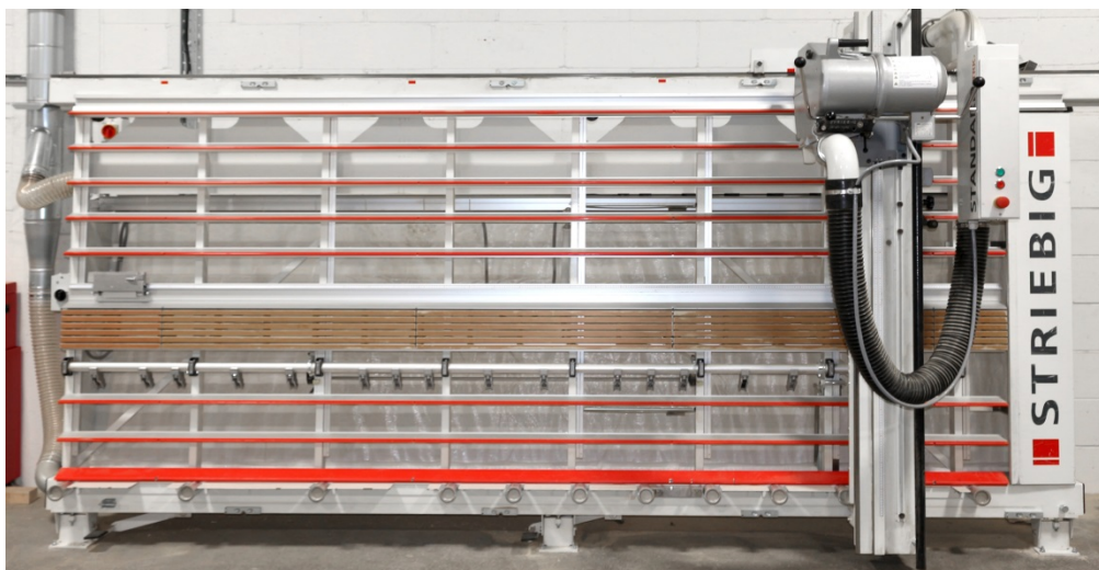
STRIEBIG STANDARD TRK2, Typ 4168

Un commerciante di legname indipendente, Bates Timber, ha acquistato due sezionatrici verticali Standard TRK2 Striebig dal fornitore leader di macchinari TM Machinery negli ultimi 18 mesi. Dopo il trasloco nella nuova sede che ha visto l'azienda di Coventry ingrandirsi più del doppio e aumentare la domanda di pannelli tagliati su misura, investire in macchinari affidabili e accurati che resistono alla prova del tempo era la massima priorità per un'impresa in continua crescita.